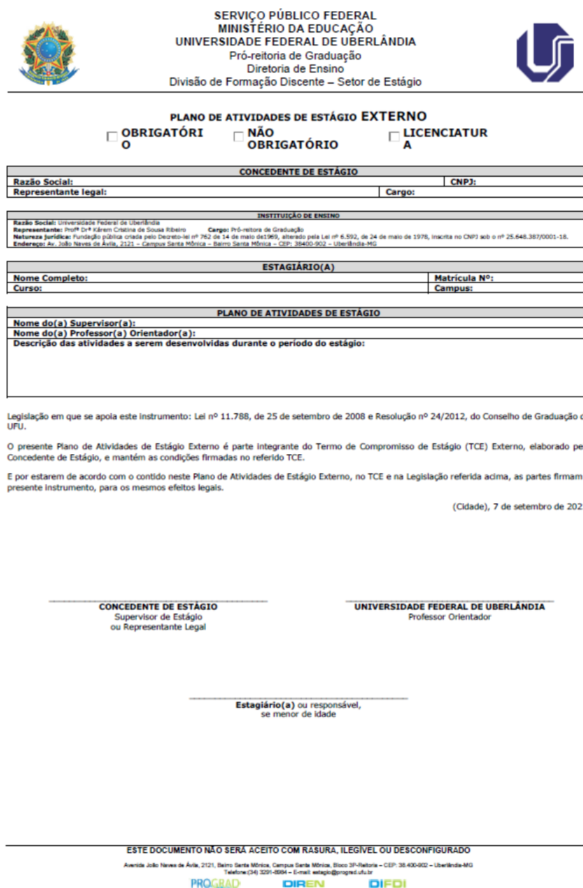
Fig. 2. Modelo do Plano de Atividades de Estágio

A Fig. 2 apresenta uma visão do referido modelo.